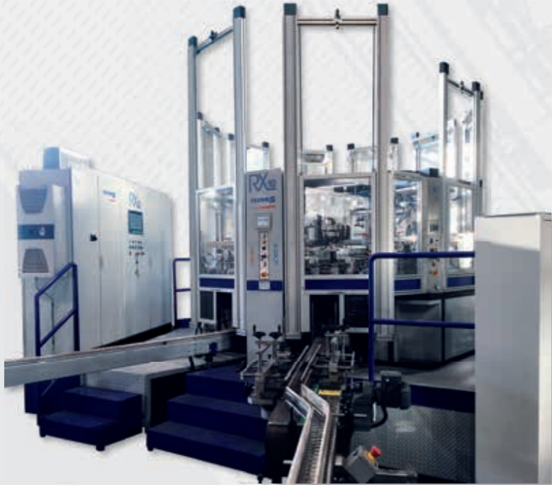
RX SERISI TAM ELEKTRONİK - UV RX8 | RX10 | RX10S | RX12 | RX17